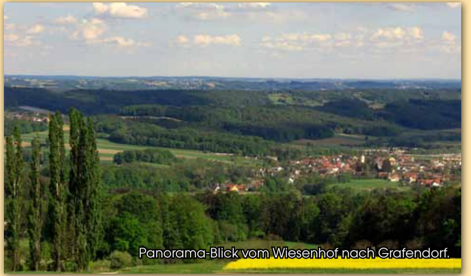
Panorama-Blick vom Wiesenhof nach Grafendorf.