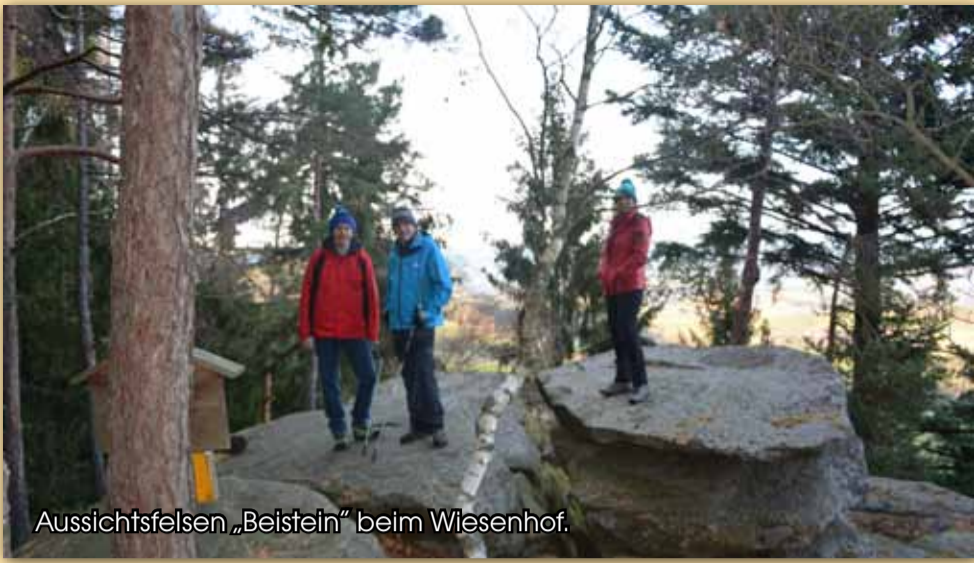
Aussichtsfelsen „Beistein“ beim Wiesenhof.