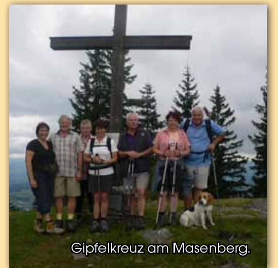
Gipfelkreuz am Masenberg.