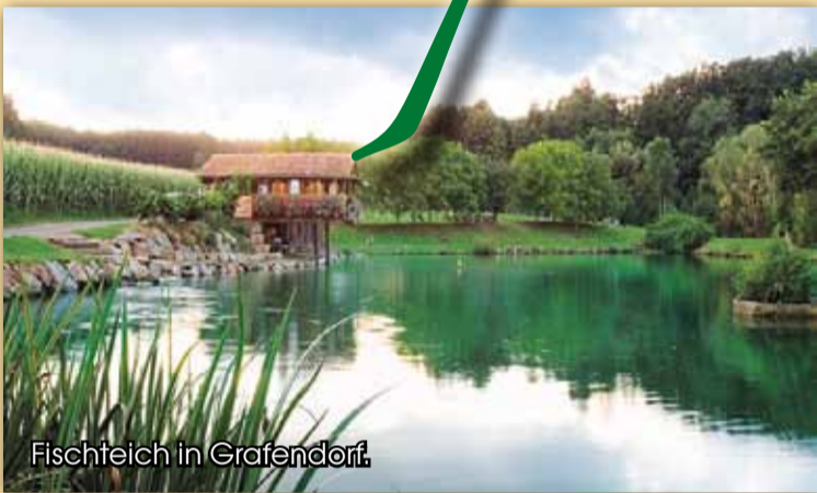
Fischteich in Grafendorf.