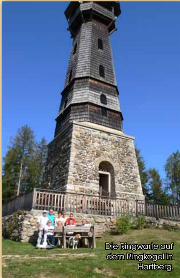
Die Ringwarte auf dem Ringkogel in Hartberg.