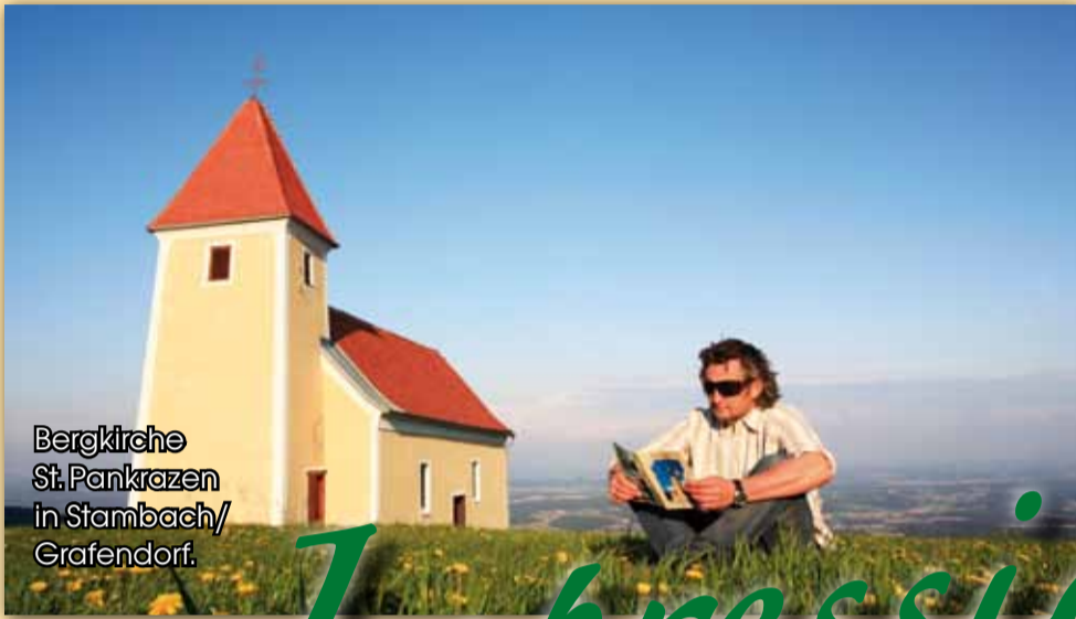
Bergkirche St. Pankrazen in Stambach/ Grafendorf.