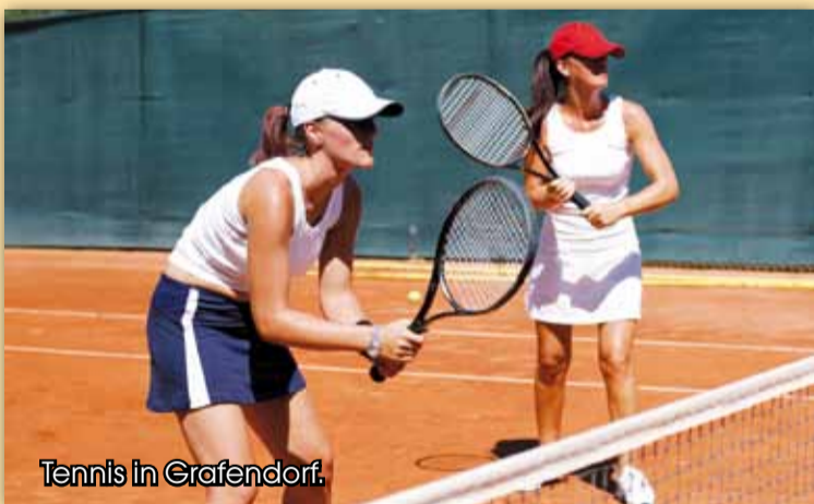
Tennis in Grafendorf.