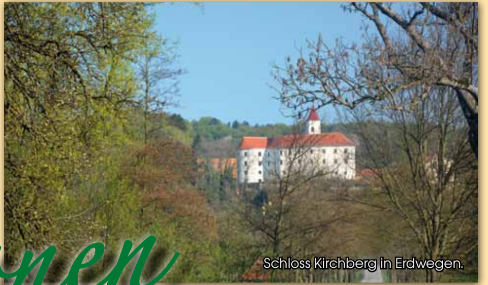
Schloss Kirchberg in Erdwegen.